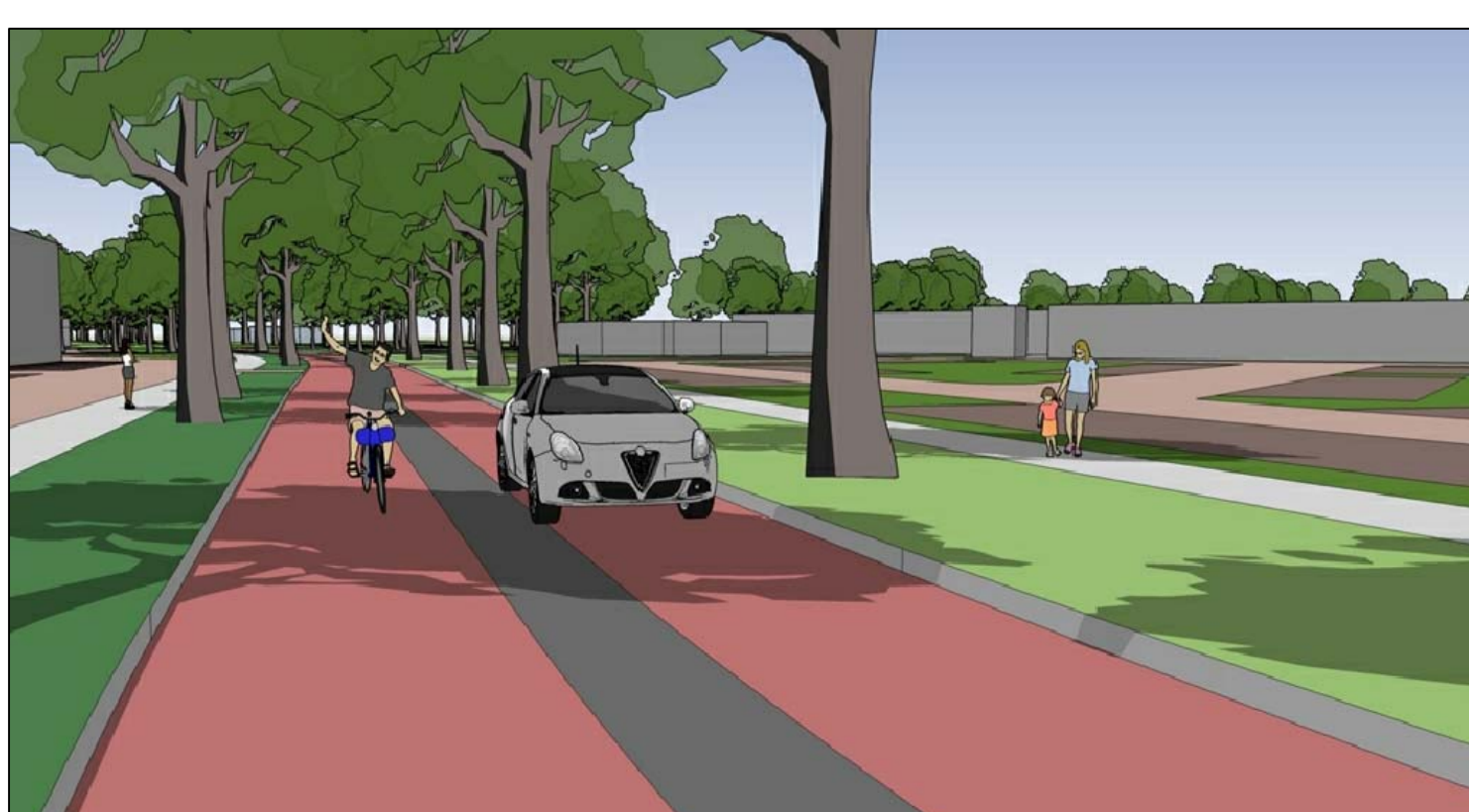
Fietsstraat 5,8 meter breed met rijbaanscheiding